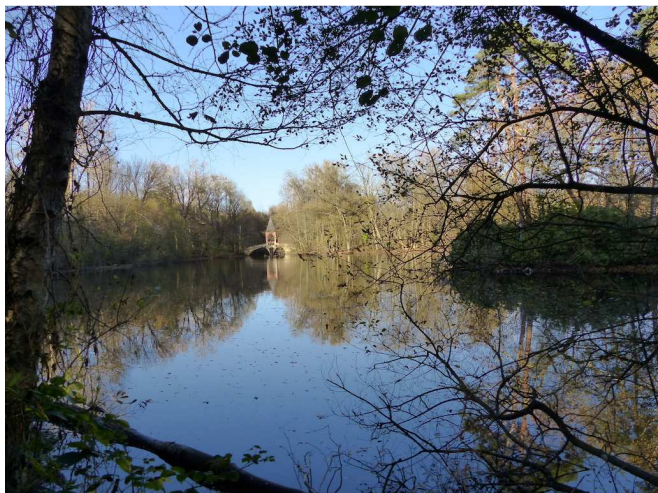
Bernaches du Canada