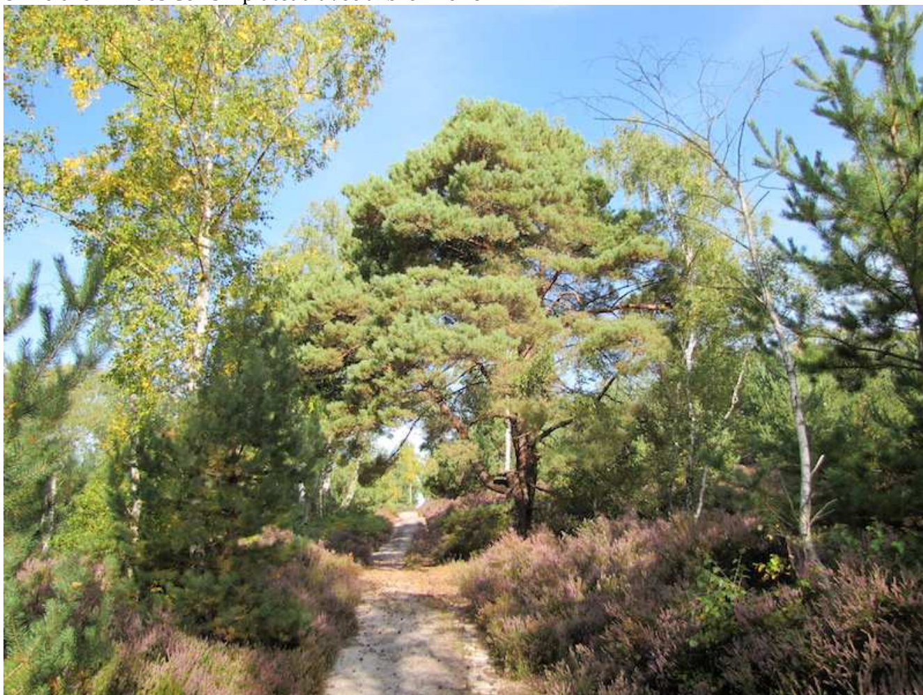
4 - le chemin des cerfs - plateau avec arbre - 2009