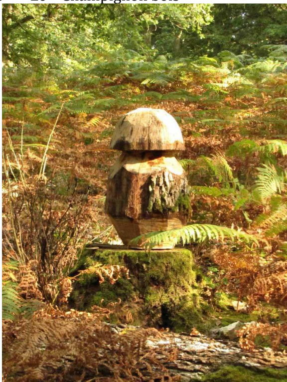
6 – « Le » Champignon bois